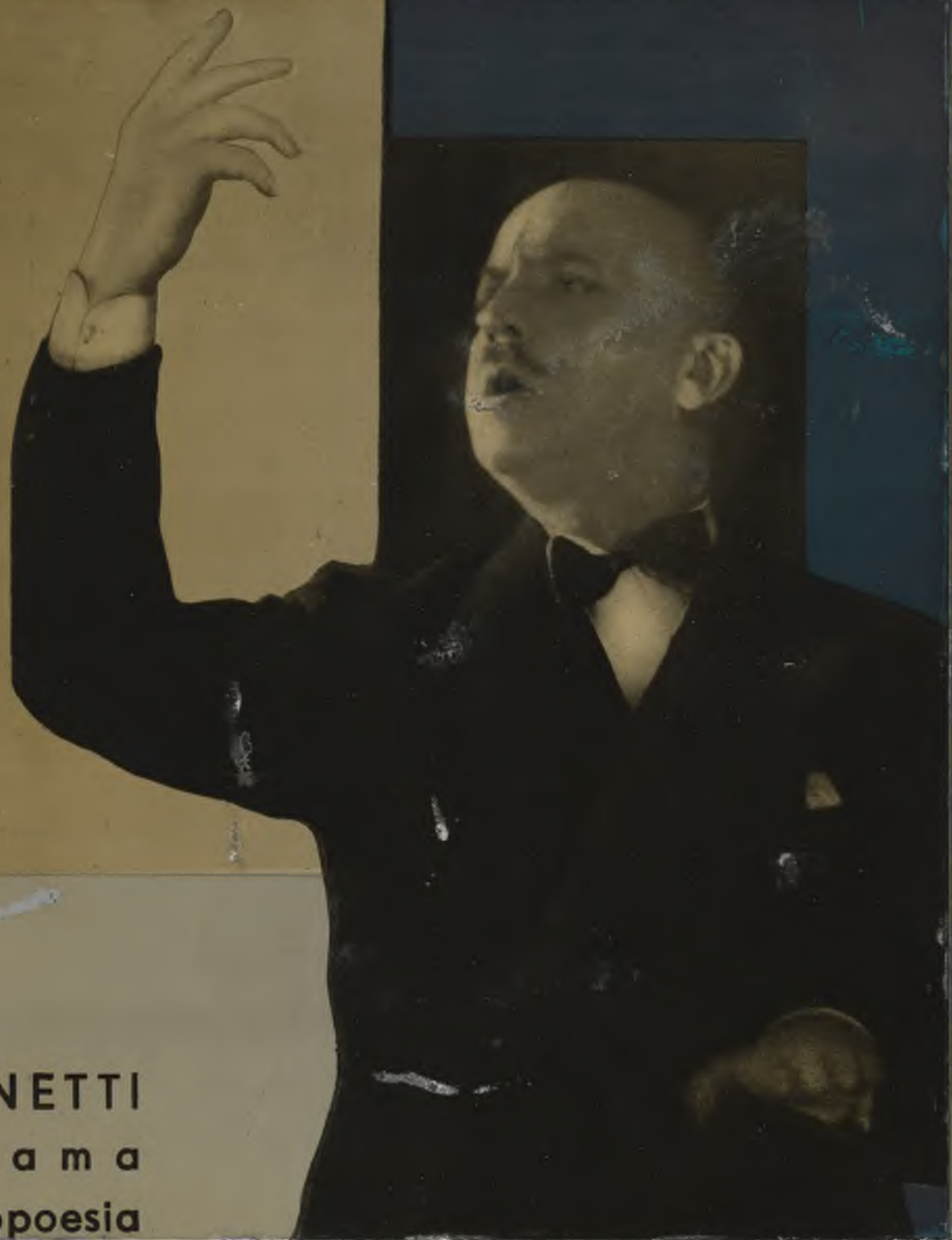
MARINETTI declama un'areopoesia